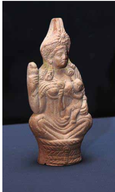
Statuette der Göttin Isis mit Harpocrates Isis, in einem Korb sitzend, stillt ihren Sohn Harpocrates Tonstatuette, H. 14,5 cm, römisch, 1. Jh. v. - 4. Jh. n. Chr. Hamburg, Museum für Kunst und Gewerbe

Die große archäologische Schau im Karlsruher Schloss ermöglicht nun einen einzigartigen und umfassenden Blick auf die unerschöpfliche Vielfalt religiösen