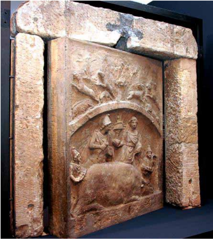
Mithrasstein von Frankfurt-Heddernheim, Rückseite

Heiligtümern zu einem der beliebtesten Kulte. Die Heiligtümer der Gottheit, die Mithraen, weisen einen charakteristischen Grundriss auf: Zwei seitliche Liegebänke (Podien) flankierten einen Mittelgang, an dessen Stirnseite sich das zentrale Kultbild befand. Die Anhänger entstammten allen gesellschaftlichen Schichten, Frauen waren jedoch ausgeschlossen.