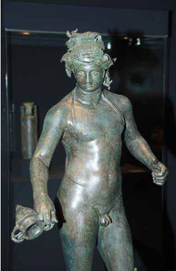
Bild: Statuette des Dionysos/Bacchus. Pompeji. 1. Jh. n. Chr. Archäologisches Nationalmuseum Neapel.

Die seit dem 7./6. Jh. v. Chr. in der griechischen, später auch in der römischen Welt verbreiteten Mysterien setzten eine rituelle Einweihung (griech. my.sis , lat. initiatio ) voraus. Deren geheime Riten unterlagen