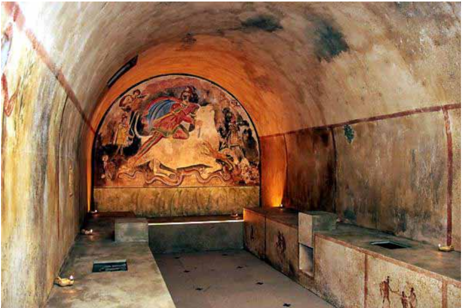
Inszenierung des Mithräums von Santa Maria Capua Vetere

In diesem Heft S. 19: Mithras in der Region - Die Seiten auf Landeskunde online/kulturer.be