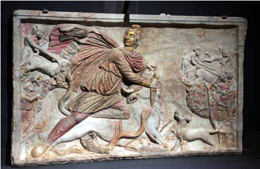
Mithrasstein aus dem Mithräum unter San Stefano Rotondo in Rom vom Ende des 3. Jahrhunderts (Marmor, Höhe 90,5 cm. Breite 148 cm). Rom, Museo Nazionale Romano, Terme di Diocleziano

Die Herkunft der römischen Gottheit Mithras liegt im Dunkeln. Eine direkte Verbindung zwischen einer in Indien, Persien und Kleinasien als Mit(h)ra bezeichneten Gottheit und dem römischen Mithraskult lässt sich nicht feststellen. Vom Ende des 1. Jh. bis zum Ende des 4. Jh. gehörte er in vielen Teilen des Reiches mit insgesamt mehr als 500 nachgewiesenen