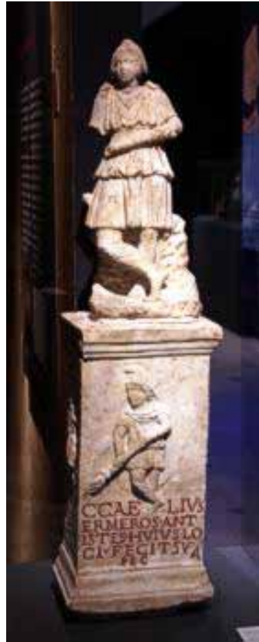
Statuette des Cautes auf einem Sockel, Mithräum des sog. Kaiserpalastes Ostia. Marmor, Gesamthöhe ca. 90 cm. Citta del Vaticano, Musei Vaticani, Museo Gregoriano Profano ex Lateranense.

ehrten Mithras, der aus dem Osten ins Römische Reich eindrang, zählte zu den Mysterienkulten. Das Badische Landesmuseum ist bereits im Besitz zweier der hochwertigsten und größten Mithrasreliefs überhaupt: Das aus Osterburken und Heidelberg-Neuenheim.